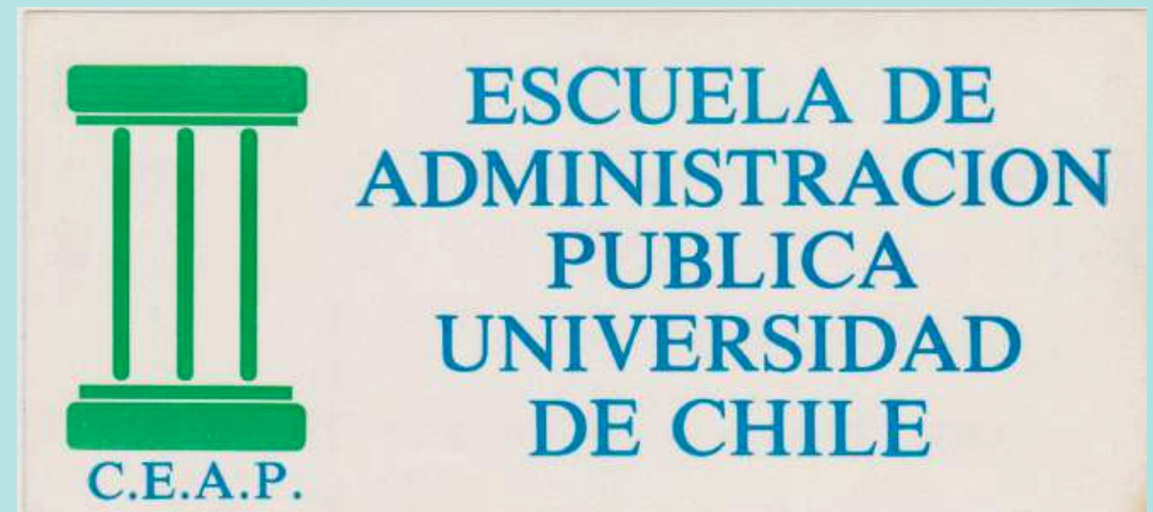
Logo de Centro de Estudiantes de Administración Pública, Década de los 90'.