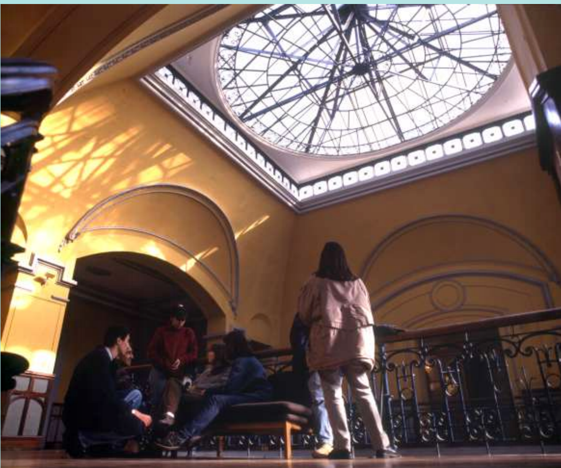
Segundo Piso Palacio Matte, 1996.