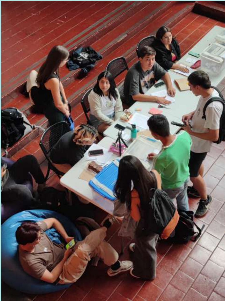
Estudiantes en Sede Huérfanos.