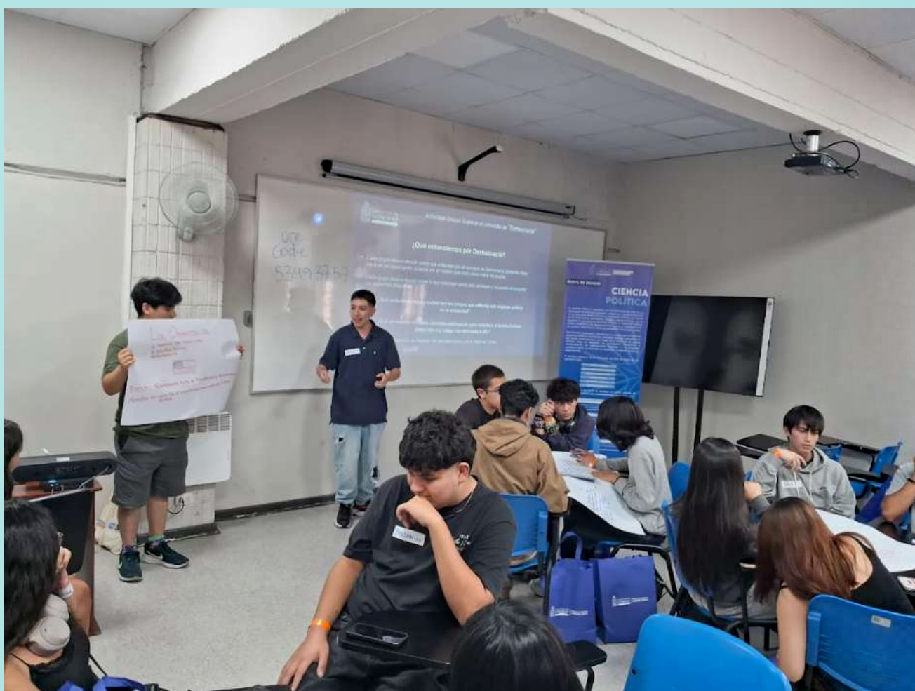
Estudiantes de la carrera Ciencia Política.