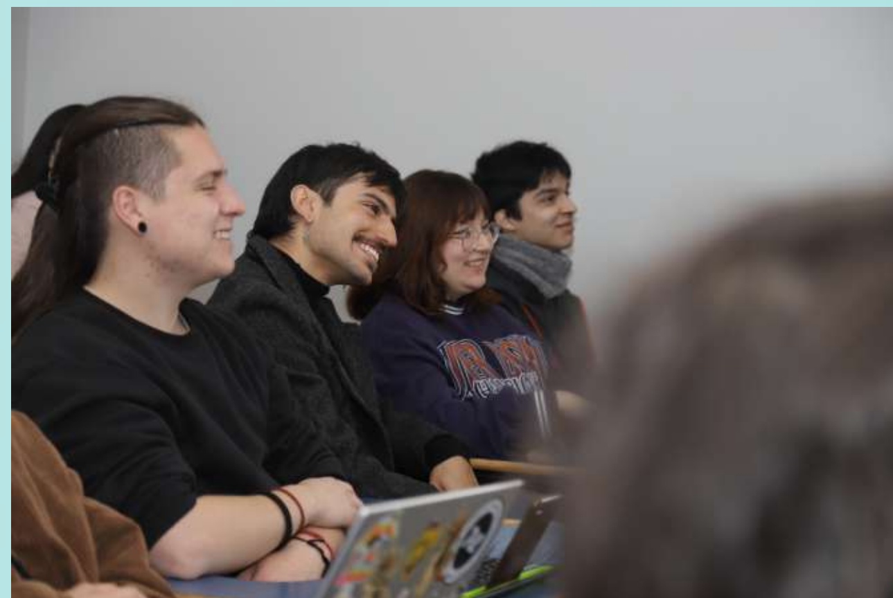
Estudiantes de la Escuela de Gobierno y Gestión Pública