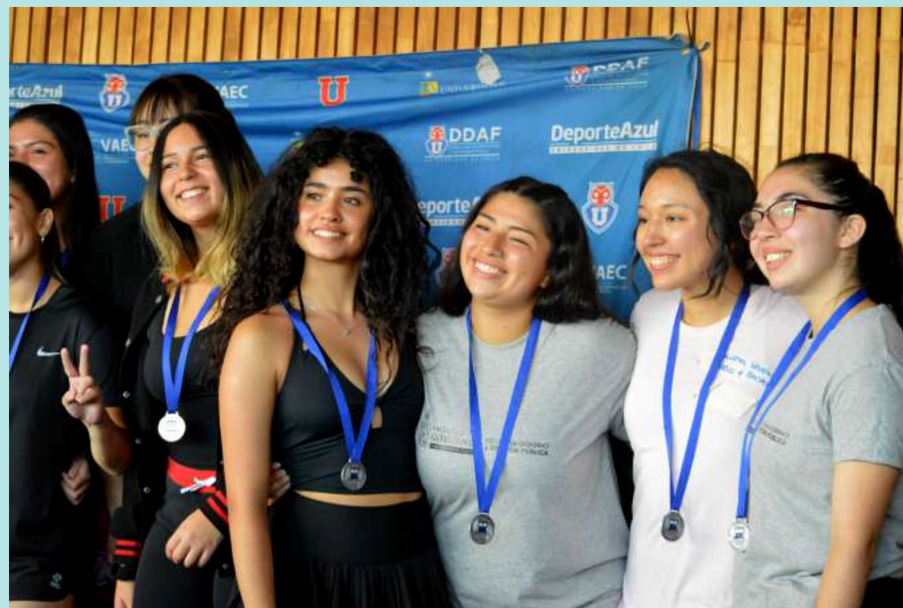
Juegos Deportivos Mechones 2025.

Instagram CDE: https://www.instagram.com/cdegobierno/