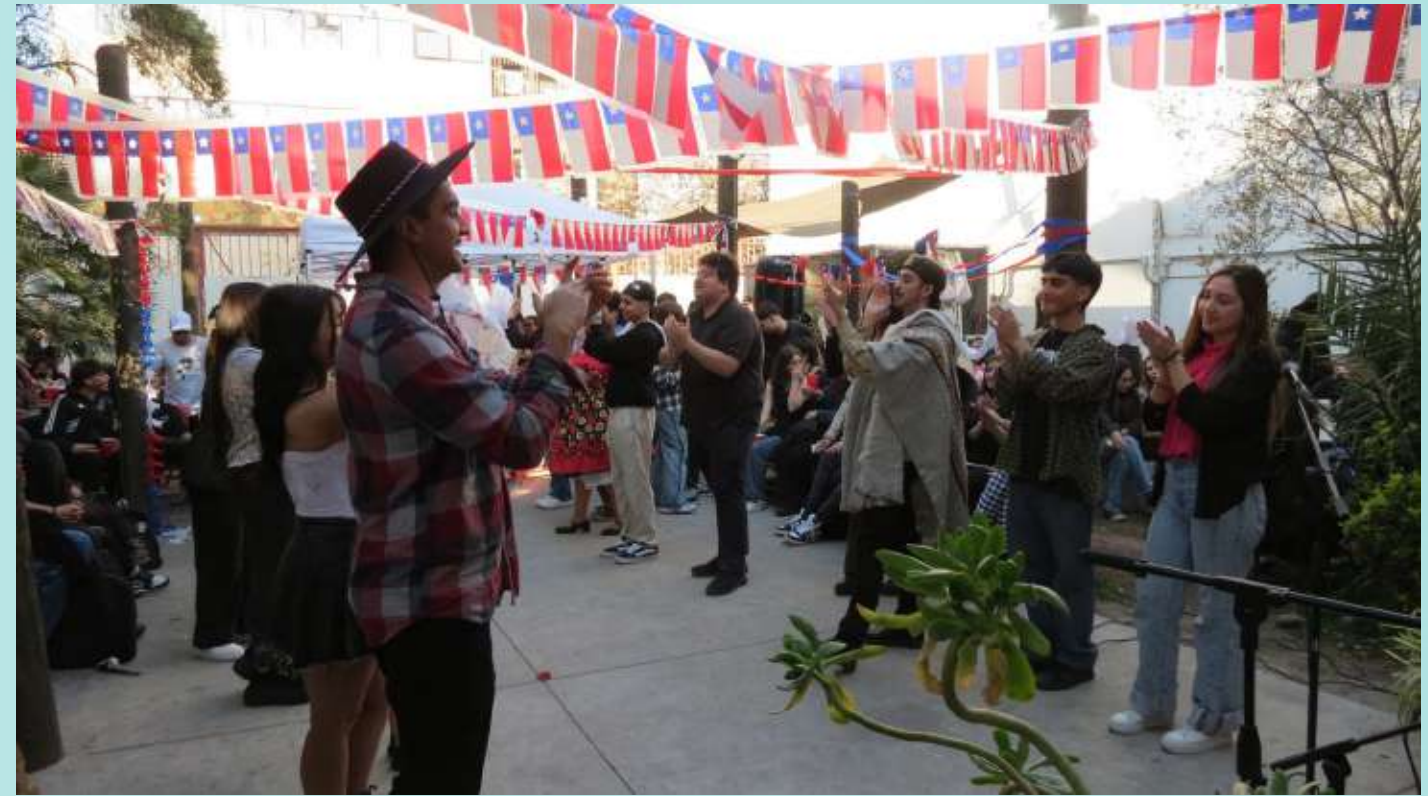
Celebración de Fiestas Patrias.