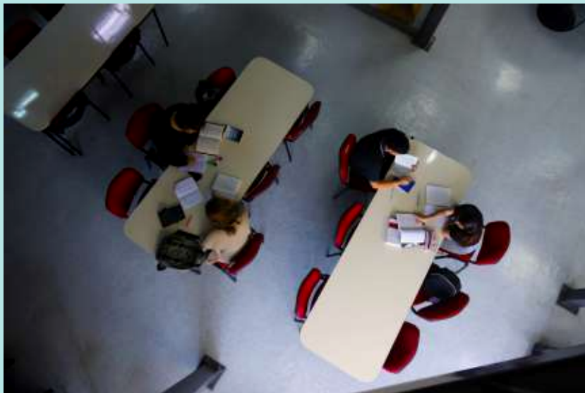
Biblioteca "Gabriel Amunátegui".

La Biblioteca Gabriel Amunátegui de la Facultad de Gobierno apoya la docencia y el aprendizaje de los estudiantes de pregrado. Cuenta con un acervo de cerca de 15.000 volúmenes, incluyendo libros, revistas académicas y materiales de estudio (dispositivos electrónicos y materiales audiovisuales), disponibles para la comunidad universitaria. La biblioteca atiende a estudiantes, docentes, personal de la Facultad e incluso usuarios externos, ofreciendo servicios de consulta en sala y préstamo a domicilio de material bibliográfico. Además, brinda acceso a los recursos de información de la Universidad de Chile, tales como: Biblioteca Digital, bases de datos académicas y repositorios institucionales. Los estudiantes pueden utilizar computadoras para búsquedas bibliográficas, solicitar el servicio de préstamo interbibliotecario (para obtener libros de otras bibliotecas universitarias conveniadas), reservar libros en línea y acceder a colecciones digitales en texto completo con su cuenta Uchile, en el portal de Bibliotecas Uchile.