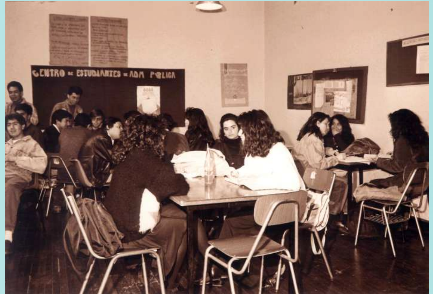
Estudiantes Administración Pública, 1996.

El Administrador(a) Público(a) de la Universidad de Chile es un profesional que hace realidad las aspiraciones de Andrés Bello, contribuyendo con orgullo a la construcción de una sociedad más justa.