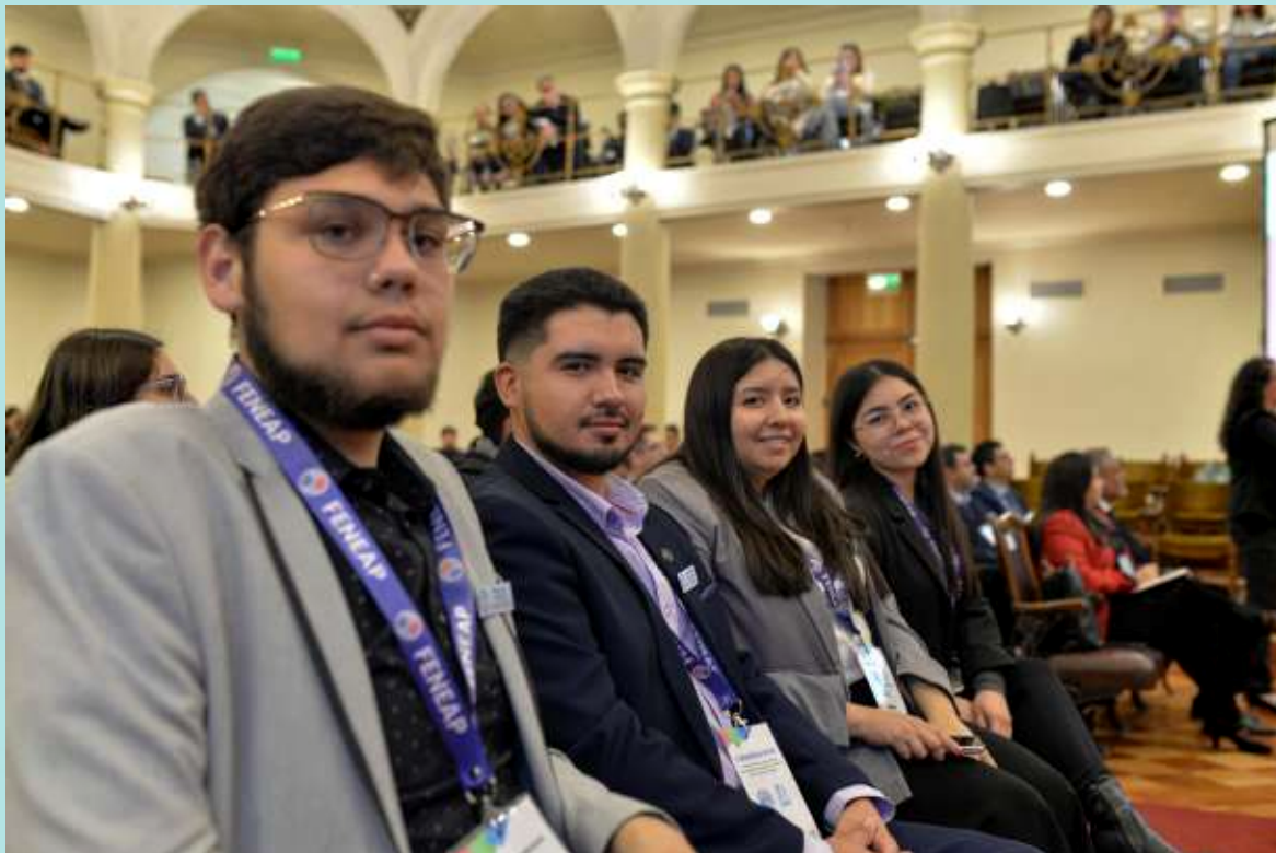
Estudiantes en el Salón de Honor, Casa Central, Universidad de Chile.