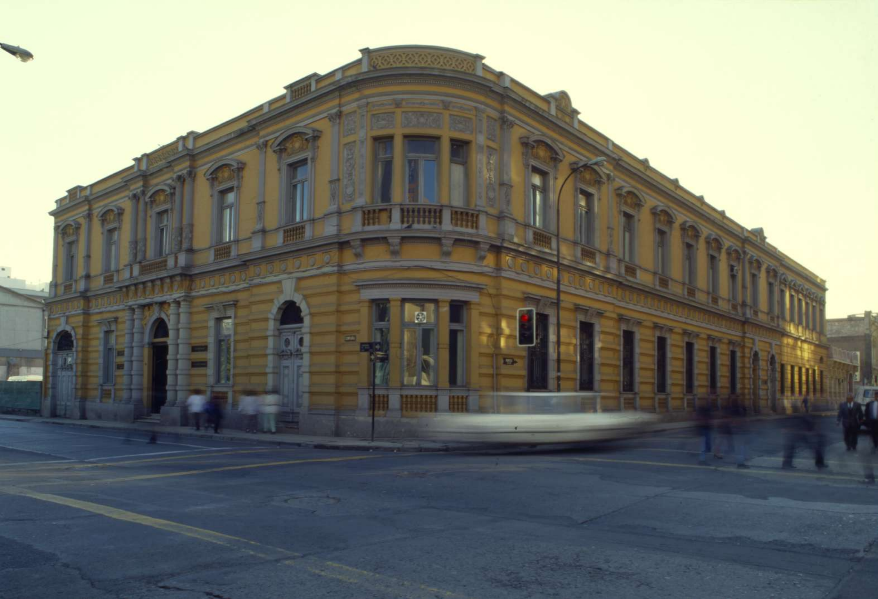
El Palacio Matte fue el lugar donde se llevaron a cabo las principales actividades académicas y de extensión de la Escuela en la década de los 90' hasta el año 2010, producto del terremoto quedó con graves daños, por lo que se debió mudar la Escuela a la calle Moneda y posteriormente en 2017 a calle Huérfanos 1724.