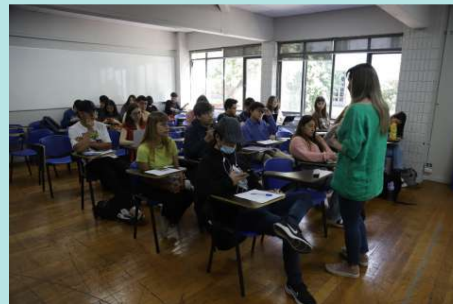
Catedra de Relaciones Internacionales.

El/la cientista político/a de la Universidad de Chile tiene una visión abierta de los asuntos públicos al integrar las lógicas de las diversas organizaciones no estatales como las del sector privado, el mundo social y los organismos internacionales.