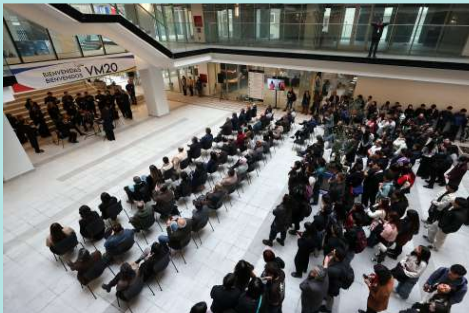
Entrega Llaves VM20.

La carrera ofrece la posibilidad de cursar también los programas de Magíster de la Facultad de Gobierno, a través de sus programas de continuidad de estudios.