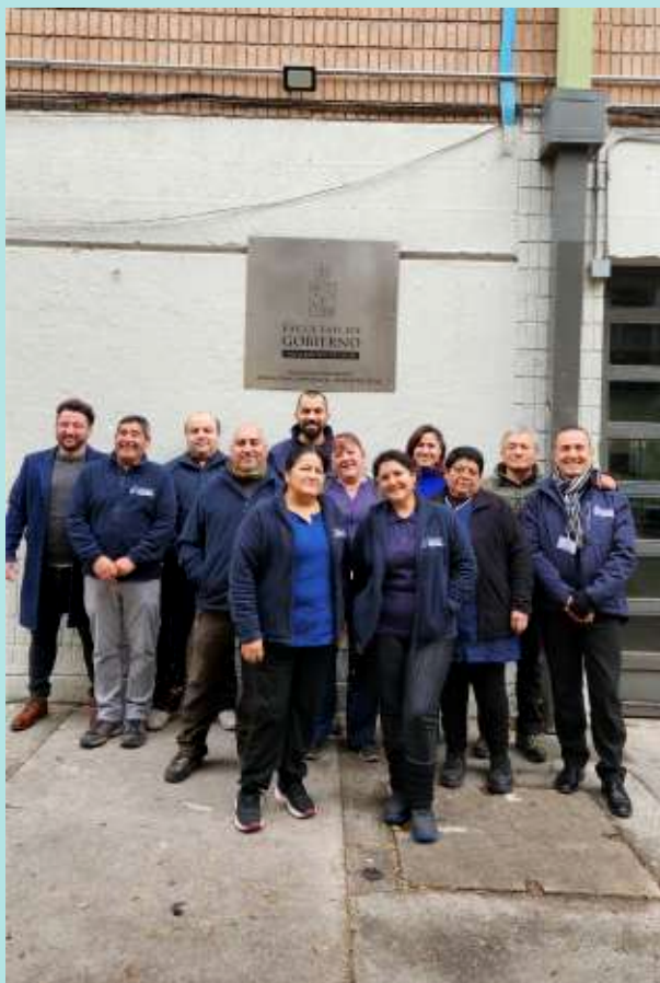
Equipo Unidad Gestión Institucional.

La Coordinación de Gestión Institucional apoya el funcionamiento administrativo y estratégico de la Escuela de Gobierno y Gestión Pública. Su labor abarca la planificación y supervisión de procesos internos para asegurar una gestión eficiente, transparente y alineada con las políticas institucionales de la Facultad y la Universidad. Esta unidad colabora en la implementación de mejoras continuas, apoyo a la acreditación y calidad, y sirve de enlace con las instancias centrales de la Universidad en materias de administración y desarrollo institucional. En términos prácticos, la Coordinación de Gestión Institucional participa en la organización de la infraestructura y recursos de la Escuela, la optimización de procesos administrativos y el seguimiento de indicadores de gestión académica y financiera, contribuyendo así a un adecuado soporte para la docencia, investigación y extensión.