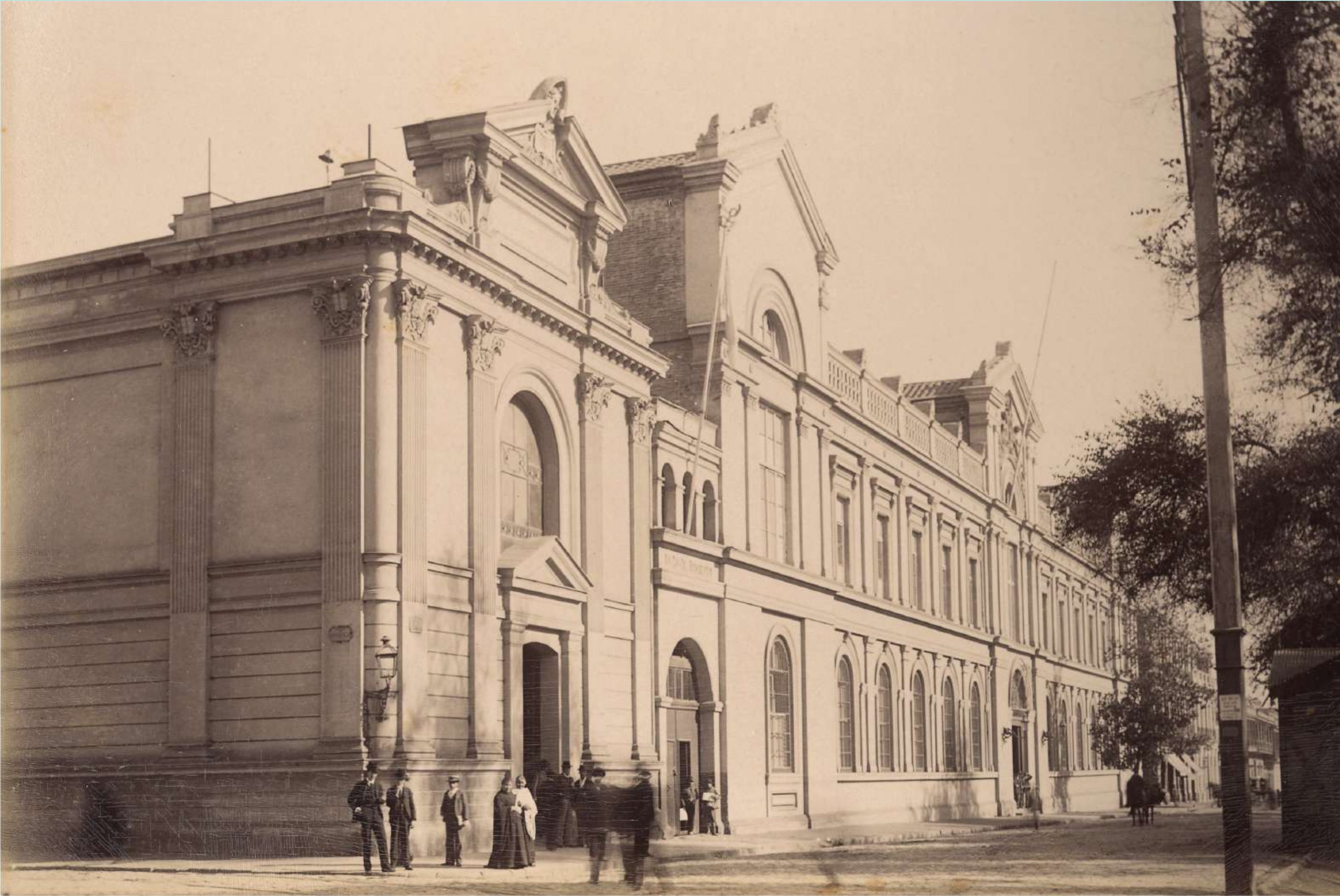
Frontis Casa Central Universidad de Chile, 1890.