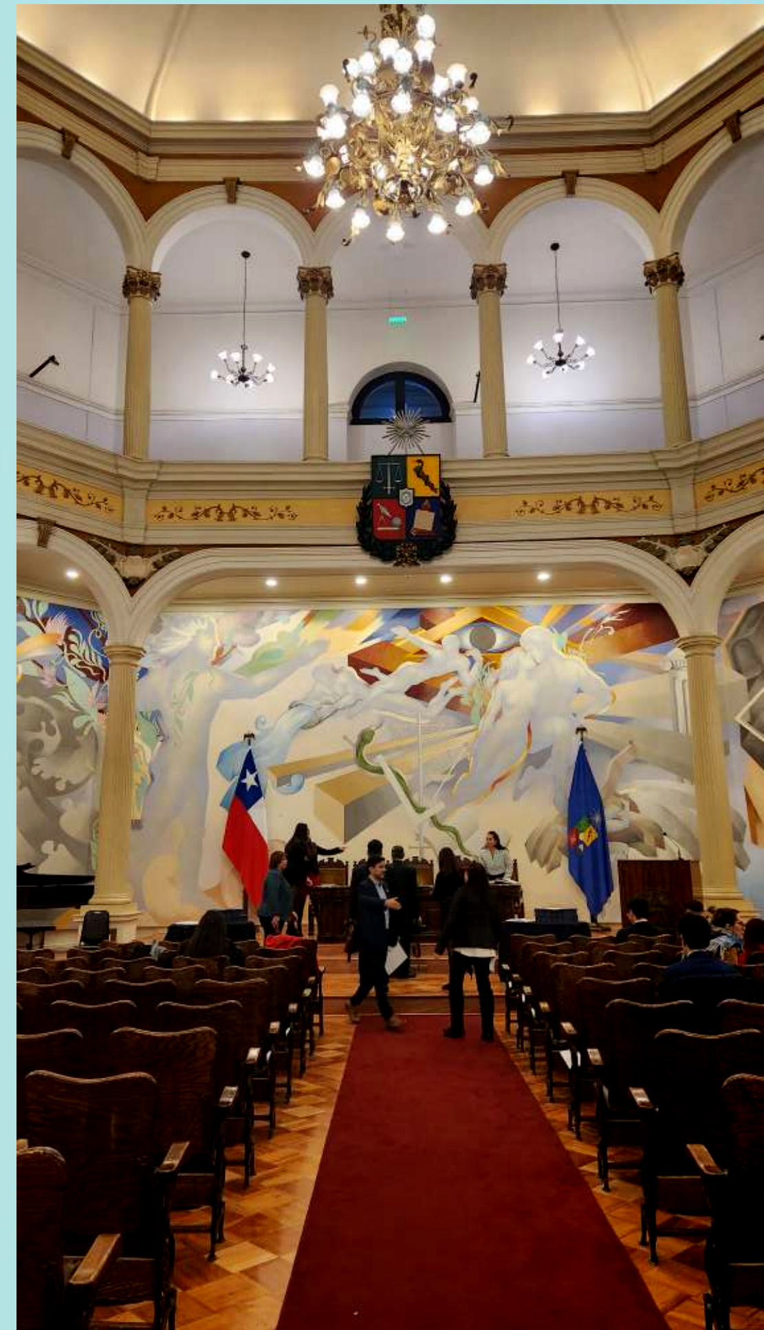
Salón de Honor, Casa Central, Universidad de Chile.