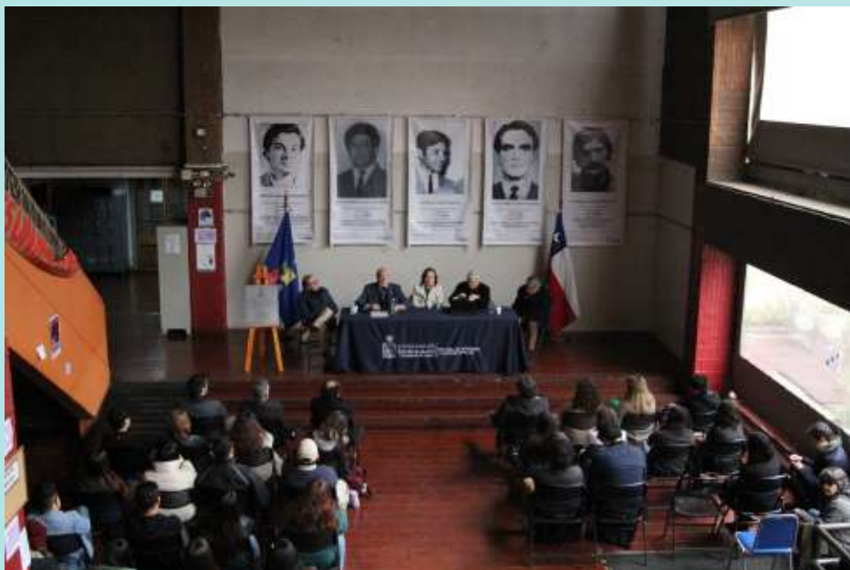
Acto conmemoración 11 de septiembre.