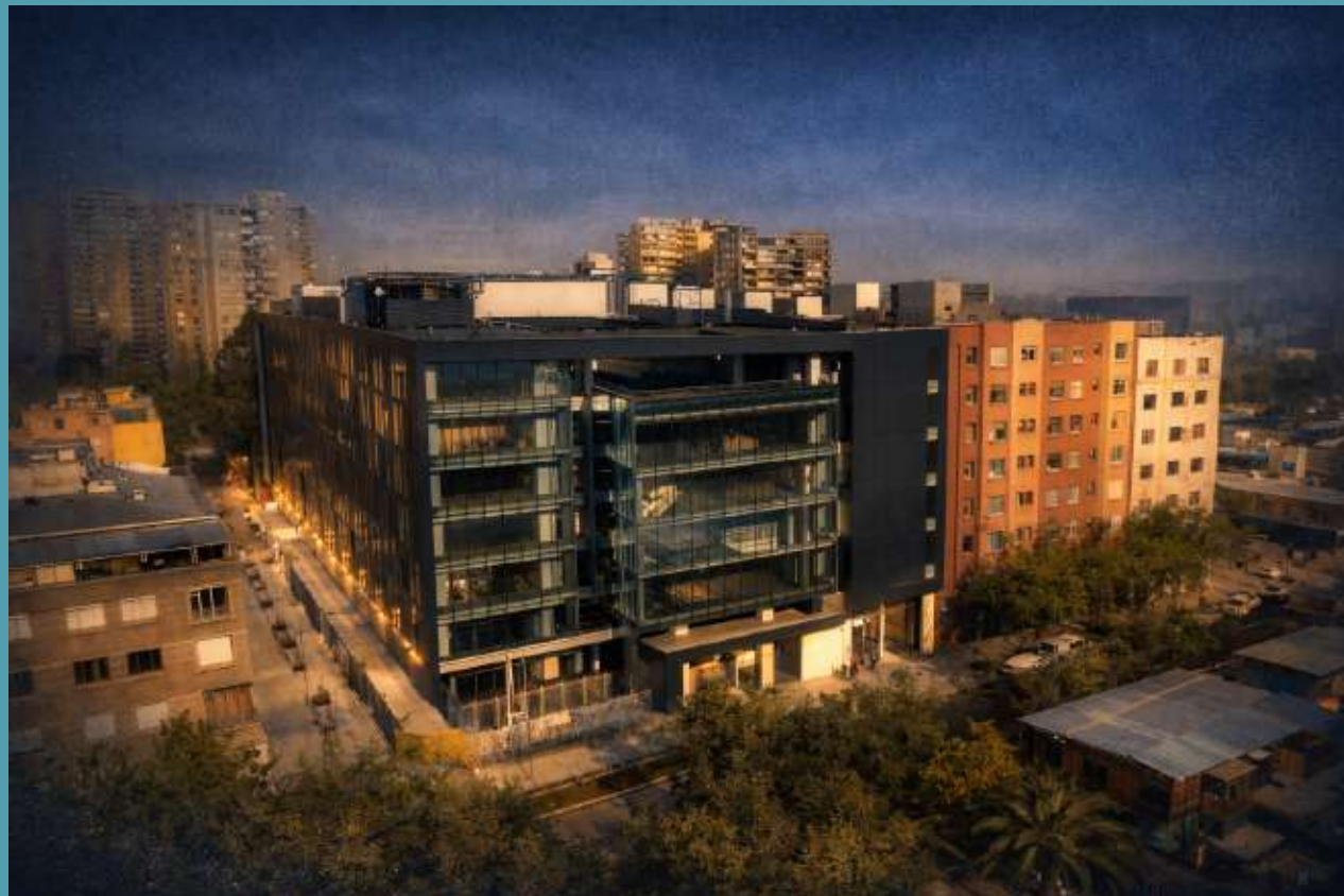
Frontis Complejo Universitario Vicuña Mackenna 20.

Desde el año 2022, la Escuela forma parte de la Facultad de Gobierno de la Universidad de Chile , una comunidad universitaria interdisciplinaria que se distingue por su excelencia académica y su compromiso con el desarrollo de Chile y América Latina. La Facultad orienta su quehacer a la creación, comunicación y transferencia de conocimiento teórico y aplicado en torno a la acción de gobernar, contribuyendo a la formación de profesionales y académicos de excelencia, con responsabilidad ética, espíritu crítico, capacidad de innovación y rigurosidad en el pensamiento, con el propósito de incidir en la calidad de la democracia, el desarrollo del Estado y el mejoramiento de las políticas públicas.