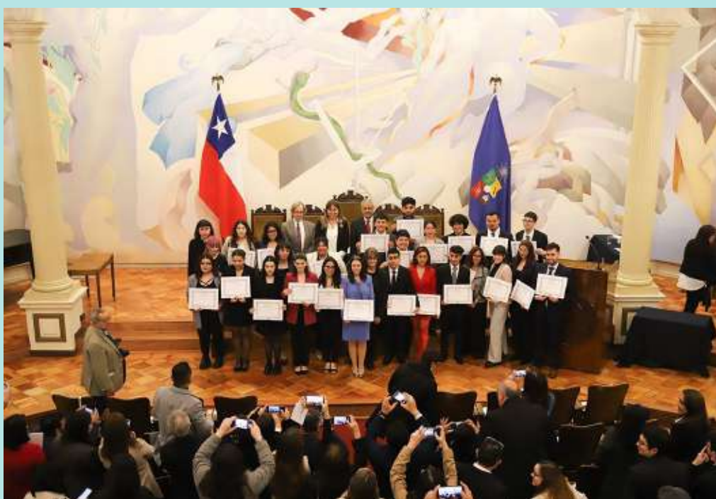
Primera Generación Titulados Ciencia Política.