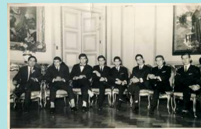
Baile de Recepción de Mechones de Administración Pública, 20 de mayo de 1965.

En el año 2026, la Escuela cumple 72 años de historia, reafirmando una trayectoria marcada por el carácter pionero en la formación de profesionales del Estado y un compromiso permanente con la excelencia académica y el fortalecimiento de la democracia.